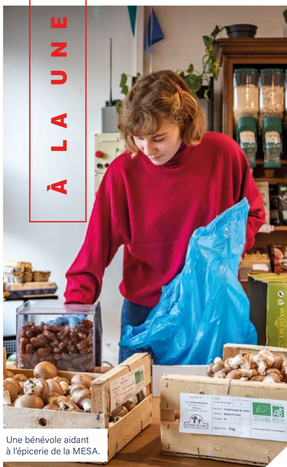
Une bénévole aidant à l'épicerie de la MESA.