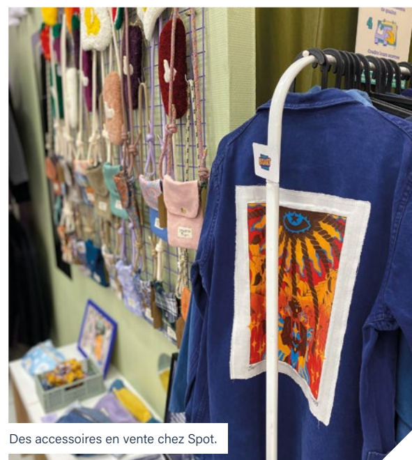
Des accessoires en vente chez Spot.

Horaires > Mardi - Samedi : 12h - 19h www.instagram.com/lespot_lyon